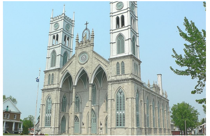
Communauté de Sainte-ANNE-de-la-Pérade