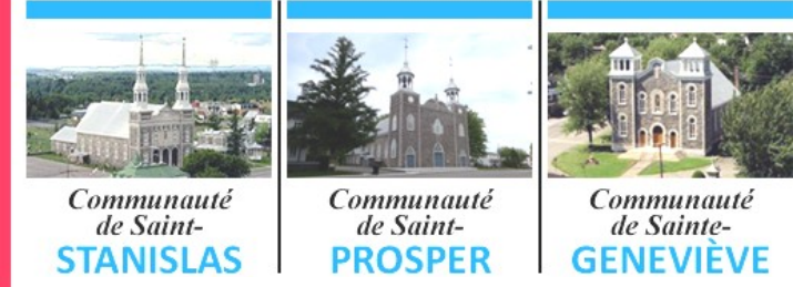
Communauté de Saint-STANISLAS, Sainte-PROSPÈRE, Sainte-GENEVIÈVE

POUR LA SEMAINE DU 10 JUILLET 2022 15 e DIMANCHE DU TEMPS ORDINAIRE