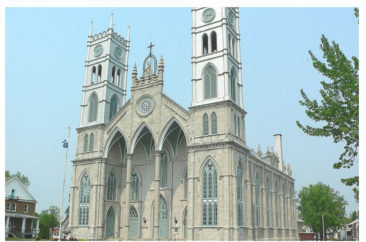
Communauté de Sainte-ANNE-de-la-Pérade