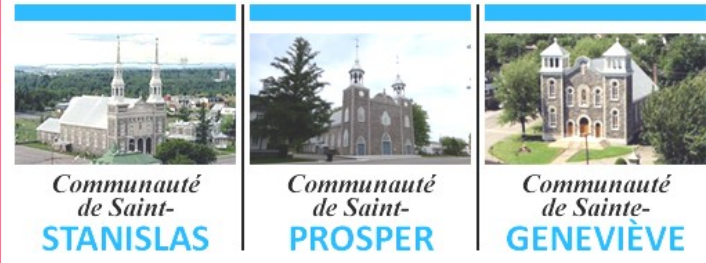
Communauté de Saint-STANISLAS Communauté de Saint-PROSPER Communauté de Sainte-GENEVIÈVE

POUR LA SEMAINE DU 11 DÉCEMBRE 2022 3 e dimanche de l'Avent