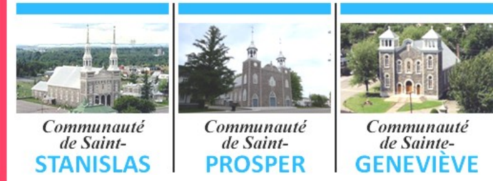
Communauté de Saint-STANISLAS Communauté de Saint-PROSPER Communauté de Sainte-GENEVIÈVE

POUR LA SEMAINE DU 13 NOVEMBRE 2022 33e DIMANCHE DU TEMPS ORDINAIRE