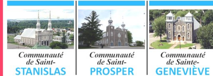
Communauté de Saint-STANISLAS