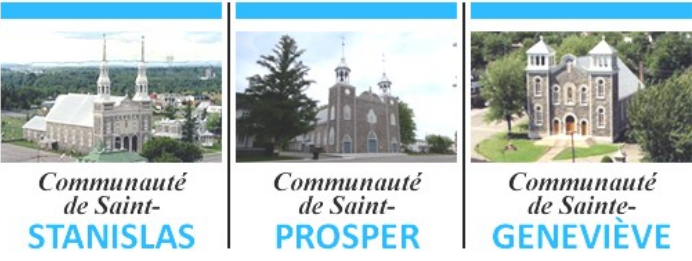
Communauté de Saint-STANISLAS, Communauté de Saint-PROSPER, Communauté de Sainte-GENEVIÈVE

POUR LA SEMAINE DU 16 OCTOBRE 2022 29e DIMANCHE DU TEMPS ORDINAIRE