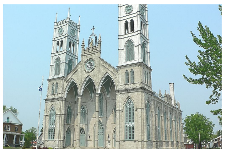
Communauté de Sainte-ANNE-de-la-Pérade