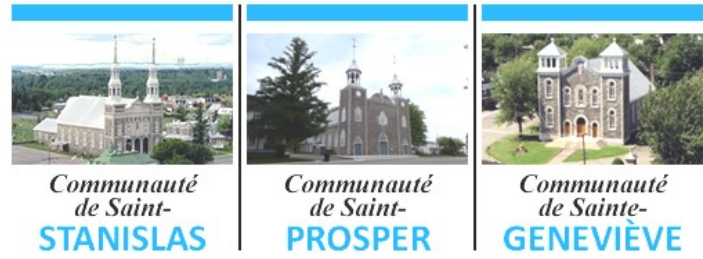
Communauté de Saint-STANISLAS, Communauté de Saint-PROSPER, Communauté de Sainte-GENEVIÈVE

POUR LA SEMAINE DU 2 OCTOBRE 2022 27 e DIMANCHE DU TEMPS ORDINAIRE