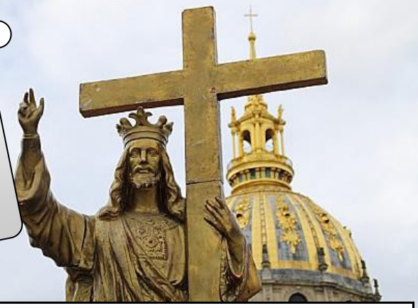
LE CHRIST ROI DE L'UNIVERS

«Dieu a jugé bon que tout, par le Christ, lui soit enfin réconcilié.» Colossiens 1, 19-20