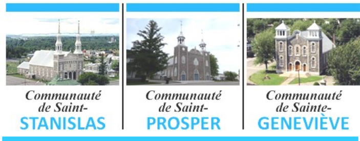
Communauté de Saint-STANISLAS, Communauté de Saint-PROSPER, Communauté de Sainte-GENEVIÈVE

POUR LA SEMAINE DU 21 AOÛT 2022 21 e DIMANCHE DU TEMPS ORDINAIRE