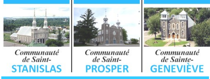
Communauté de Saint-STANISLAS, Communauté de Saint-PROSPER, Communauté de Sainte-GENEVIÈVE