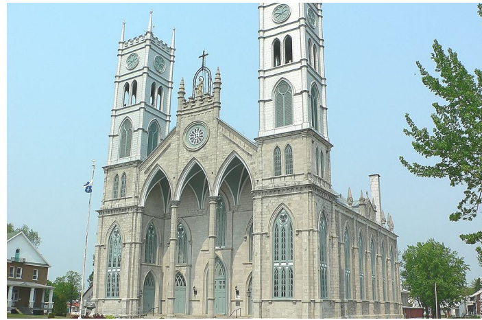
Communauté de Sainte-ANNE-de-la-Pérade