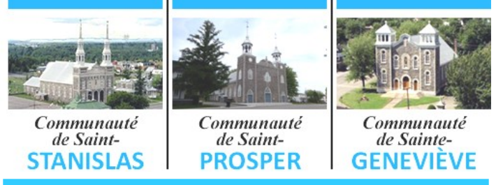
Communauté de Saint-STANISLAS, Communauté de Saint-PROSPER, Communauté de Sainte-GENEVIÈVE