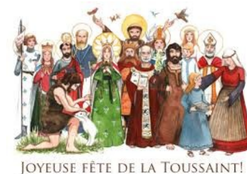
JOYEUSE FÊTE DE LA TOUSSAINT!

La solennité de Tous les saints nous rappelle que plus on est humain, plus on est saint. Devenir humain est un art, imaginez saint. Devenir chrétien ou chrétienne, devenir saint ou sainte, c'est un tout. La sainteté est la libre réalisation de ce qu'il y a de meilleur en nous. Et si c'était notre vocation profonde, à la suite du Christ ?