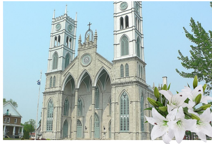
Communauté de Sainte-ANNE-de-la-Pérade