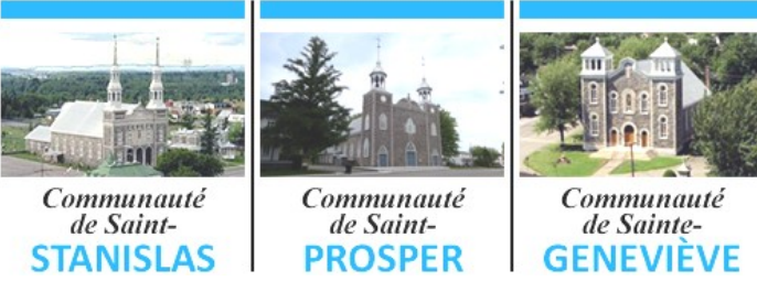
Communauté de Saint-STANISLAS Communauté de Saint-PROSPER Communauté de Sainte-GENEVIÈVE

POUR LA SEMAINE DU 5 FÉVRIER 2023 5e DIMANCHE DU TEMPS ORDINAIRE