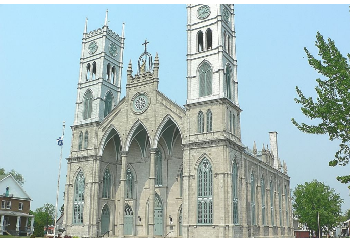
Communauté de Sainte-ANNE-de-la-Pérade