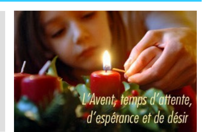
L'Avent, temps d'attente, d'espérance et de désir

«Pour le Seigneur, un seul jour est comme mille ans, et mille ans sont comme un seul jour.»